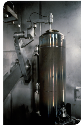
Eine HAW-Kokille wird automatisch verschweißt

Dieser HAW (High Active Waste) genannte Teil wird bei ca. 1.100 °C mit einem Spezialglasgranulat zu einem Glasprodukt verschmolzen. Die noch flüssige Glasmasse wird in einen Edelstahlbehälter, die sogenannte Kokille, gefüllt und erstarrt beim Abkühlen. Anschließend wird die HAW-Kokille mit einem aufgeschweißten Edelstahldeckel verschlossen.