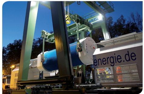
Umladung eines CASTOR®-Behälters von Schienenfahrzeug auf Straßentransporter

Strahlenabschirmung, Wärmeabfuhr und Unfallsicherheit sind bereits durch die Transport- und Lagerbehälter gegeben. Das Zwischenlagergebäude unterstützt die Aufgabe der Behälter. Der Schutz der Umwelt vor unzulässiger Strahlenbelastung ist somit stets gewährleistet.