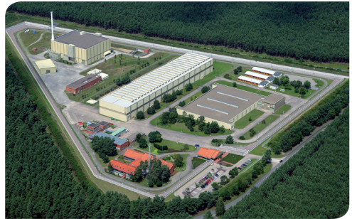
Betriebsgelände in Gorleben mit Transportbehälterlager

Neben dem wiederverwertbaren Kernbrennstoff fallen bei der Wiederaufarbeitung auch radioaktive Abfälle an, zu deren Rücknahme sich die Bundesrepublik Deutschland völkerrechtlich verpflichtet hat. Dieser Verpflichtung kommt sie selbstverständlich nach. Der Transport in CASTOR®-Behältern ist ein zuverlässiger Weg, hochradioaktive Abfälle nach Deutschland zu